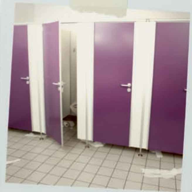
...Papierabfall auf dem Fußboden