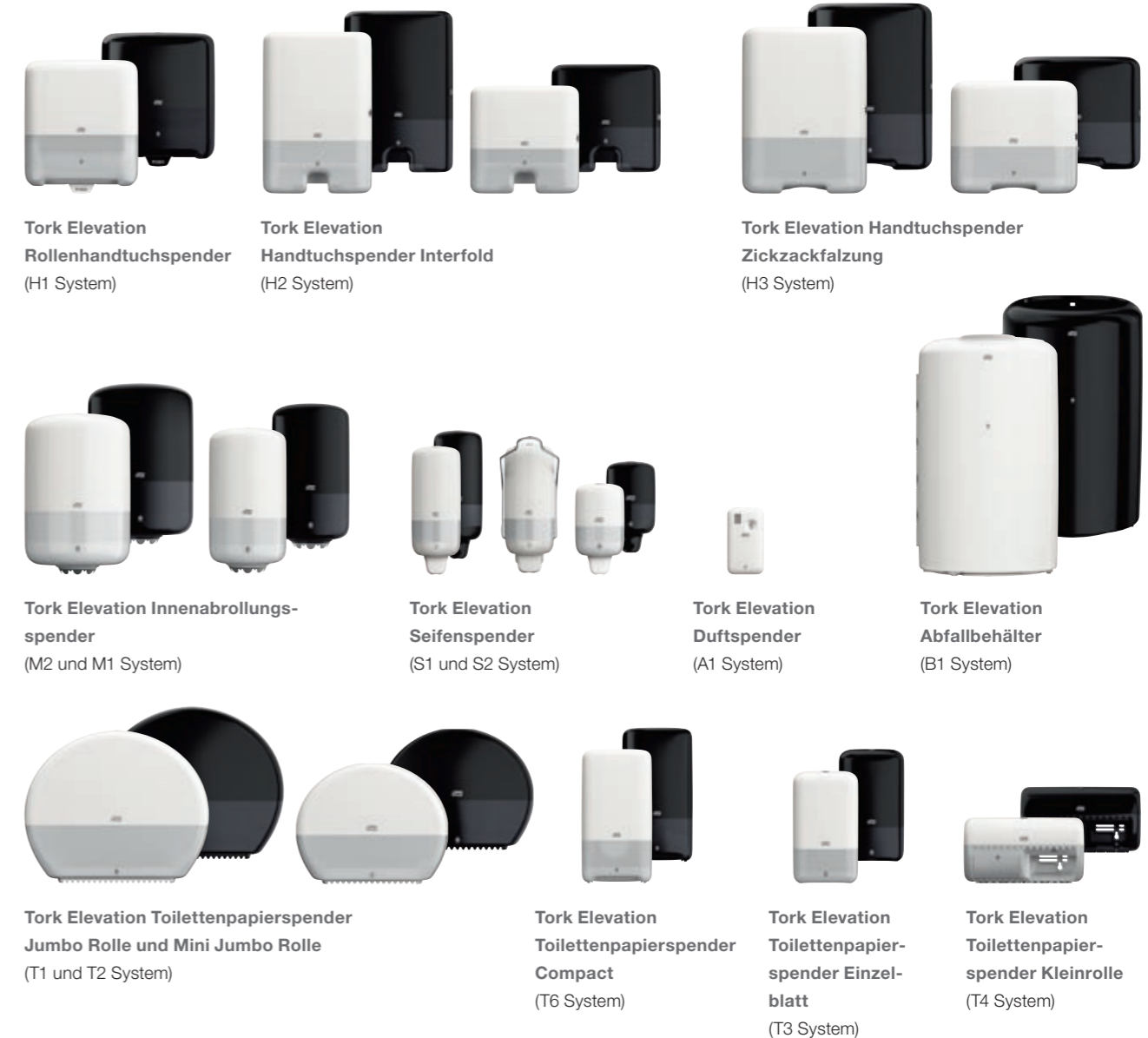
Tork Elevation Rollenhandtuchspender (H1 System)

Der Tork Elevation Toilettenpapierspender Compact ist einer von vielen innovativen Hygienespendern der Tork Elevation Spenderlinie: Innovationen kombiniert mit funktionalem Design, das sich nahtlos in jede Waschräumumgebung einfügt. Das umfangreiche Sortiment bietet eine Vielzahl neuer attraktiver Produktmerkmale. So finden Sie immer die perfekte Lösung für Ihre individuellen Anforderungen an die Waschräumhygiene und werten Ihren Waschraum deutlich auf.